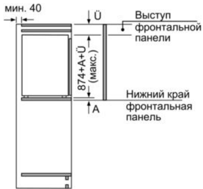
Размеры в мм